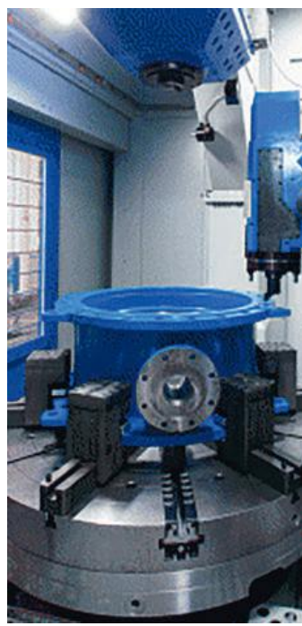
Una lavorazione in Mandelli

INACQUA CMT AL SERVIZIO DELLA TUA SALUTE